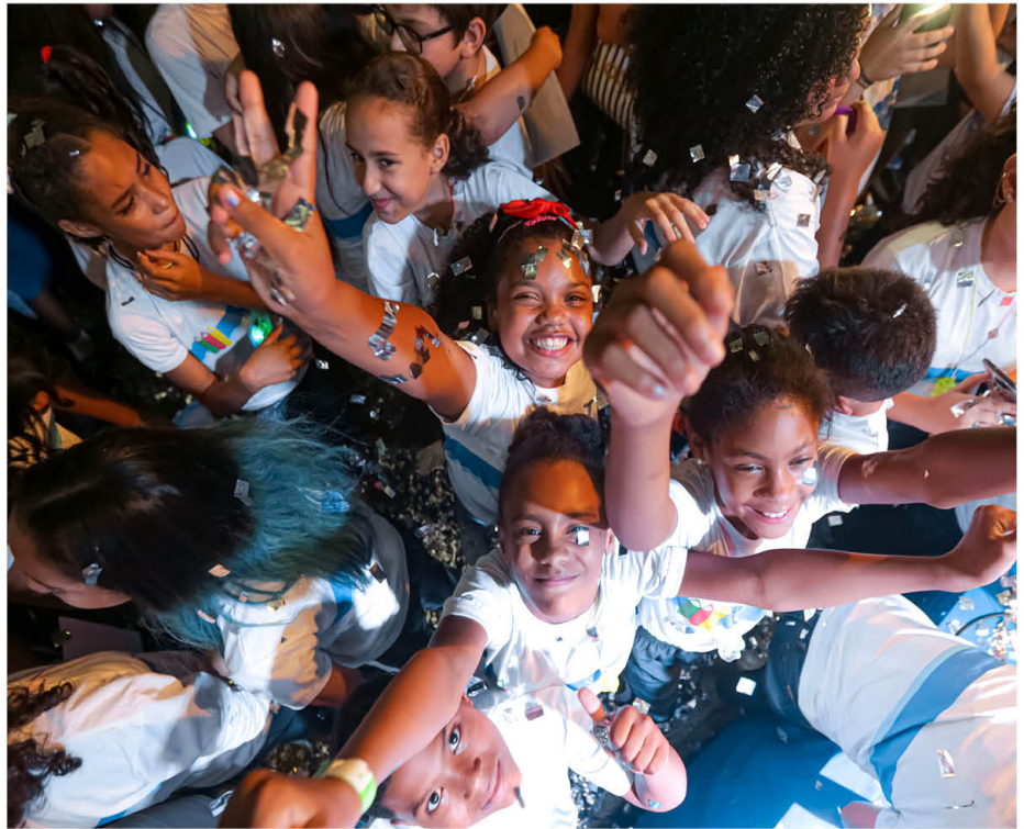
Emoção e muita alegria marcaram a formatura dos alunos de 127 turmas

Os estudantes formados neste ano, são os primeiros após o lançamento do Educa Itapevi lançado, em junho, para assegurar melhores condições de ensino para todos os alunos da rede municipal, com valorização dos professores, incentivo ao uso da tecnologia para o aprendizado e o estabelecimento de uma nova política pedagógica que servirá de base